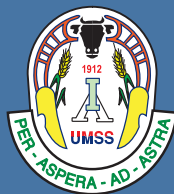
Facultad de Ciencias Agrícolas y Pecuarias